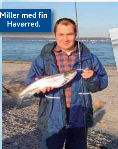
Miller med fin Havørred.