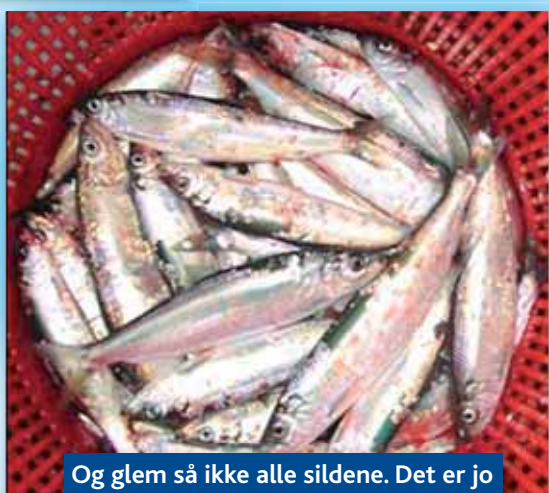
Og glem så ikke alle sildene. Det er jo trods alt dem vi fanger flest af!