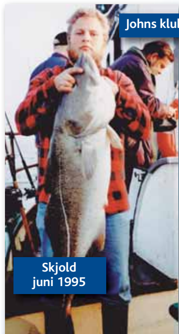
Johns klubrekord på 23 kg