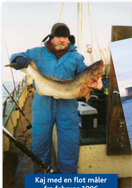
Kaj med en flot måler fra februar 1996